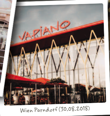
Wien Parndorf (30.08.2018)