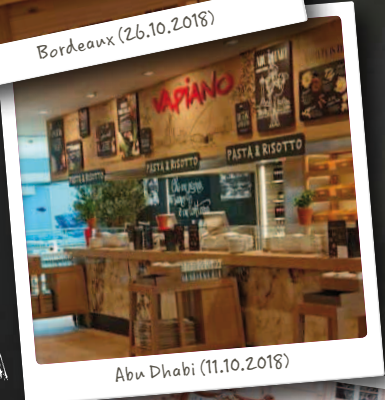
Abu Dhabi (11.10.2018)